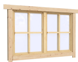
1.34×0.91 м.1 шт.