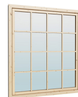
1.62×1.885 м.1 шт.