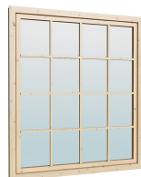
1.62×1.885 м.2 шт.