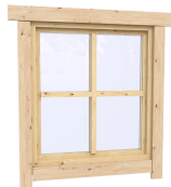
0.87×0.78 м.4 шт.