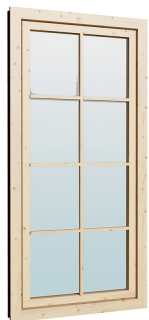
0.84×1.885 м.3 шт.