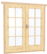
1.62×1.885 м.1 шт.

7. Наличники: сухая строганная доска 20×100 мм.;