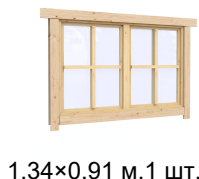
1.34×0.91 м.1 шт.