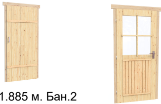
0.84×1.885 м. Бан.2 шт. 0.84×1.885 м. Остекл.1 шт.

7. Наличники: сухая строганная доска 20×100 мм.;